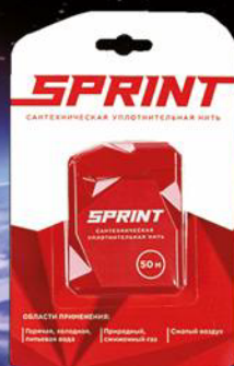
Бокс с нитью 50 м