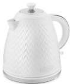
Чайник электрический Kitfort KT-681