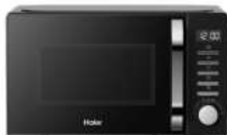
Микроволновая печь - СВЧ Haier HMB-DM208BA